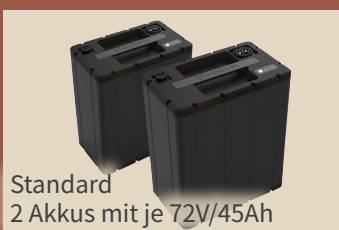
Standard 2 Akkus mit je 72V/45Ah